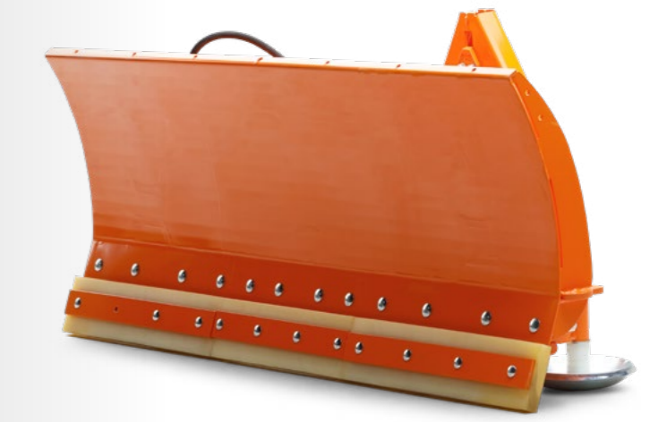
Eine von vielen Schneeschild-Optionen: von 1,30 bis 2,0 m; in verschiedenen Ausführungen