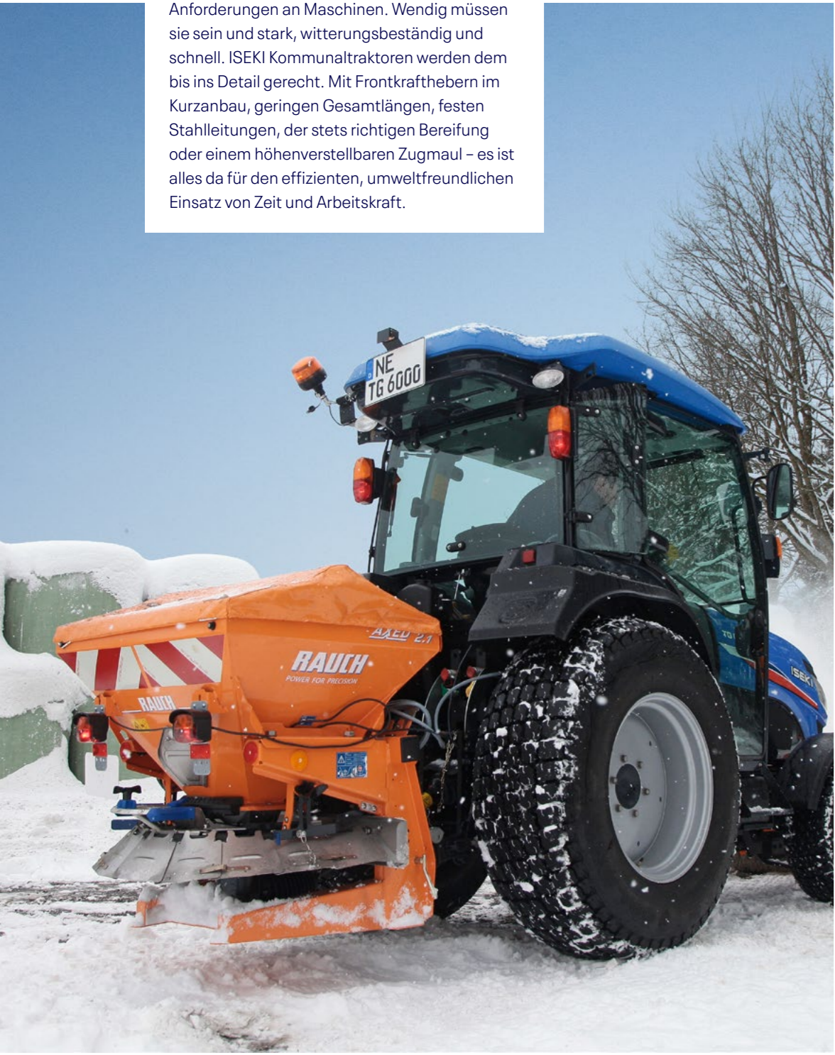
Mehr Sicherheit durch gleichmäßige Verteilung von Streugut in der kalten Jahreszeit.

Kommunaltauglichkeit auf 4 Rädern Alltag in Kommunen und Städten stellt höchste Anforderungen an Maschinen. Wendig müssen sie sein und stark, witterungsbeständig und schnell. ISEKI Kommunaltraktoren werden dem bis ins Detail gerecht. Mit Frontkrafthebern im Kurzanbau, geringen Gesamtlängen, festen Stahlleitungen, der stets richtigen Bereifung oder einem höhenverstellbaren Zugmaul – es ist alles da für den effizienten, umweltfreundlichen Einsatz von Zeit und Arbeitskraft.